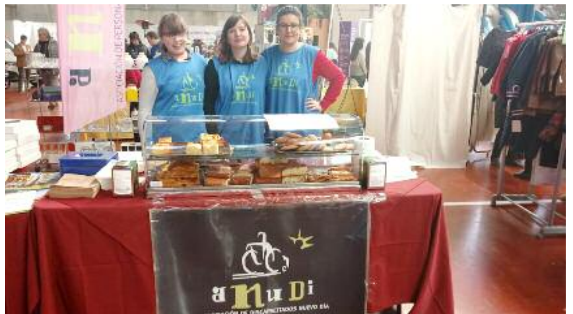
Voluntarias de Anudi en el puesto instalado en la Feria del Stock de Teruel, celebrada en el Palacio de Exposiciones