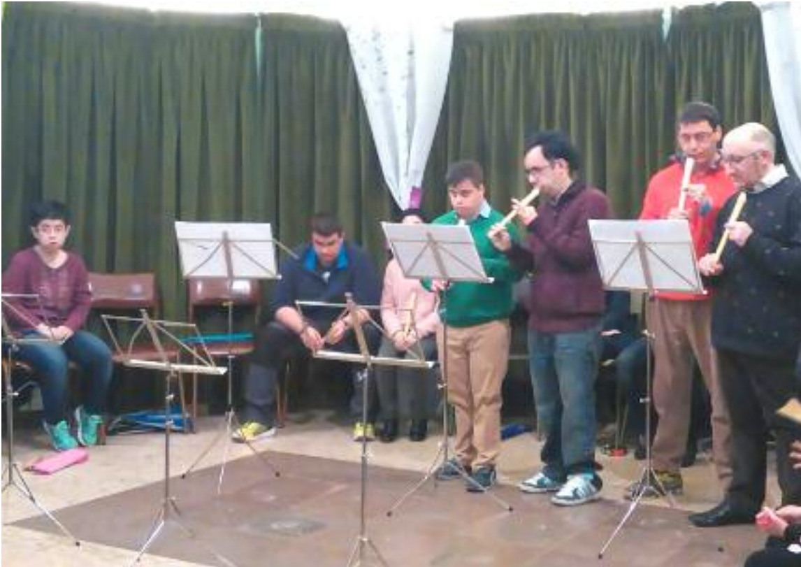
Actuación de los usuarios de ATADI Jiloca que asisten a clases de flauta en la Escuela de Música de Monreal del Campo