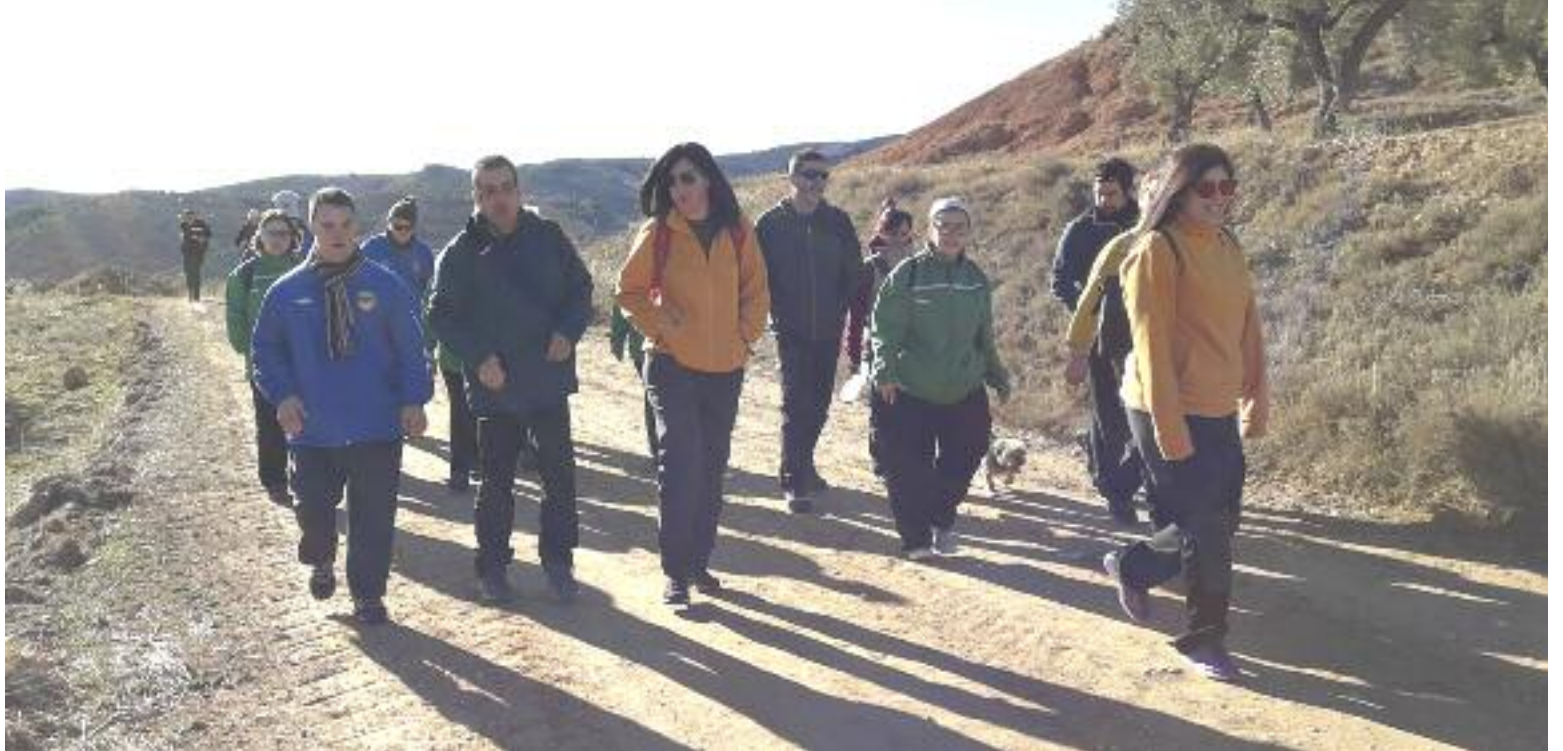
Participantes en la decimoquinta edición de la Marcha Senderista ATADI Alcorisa, incluida en la Liga de Senderismo Popular de Aragón

Todos los inscritos recibieron una riñonera y un detalle elaborado por los usuarios de ATADI Alcorisa: un ambientador de semillas, que sirve de recuerdo de