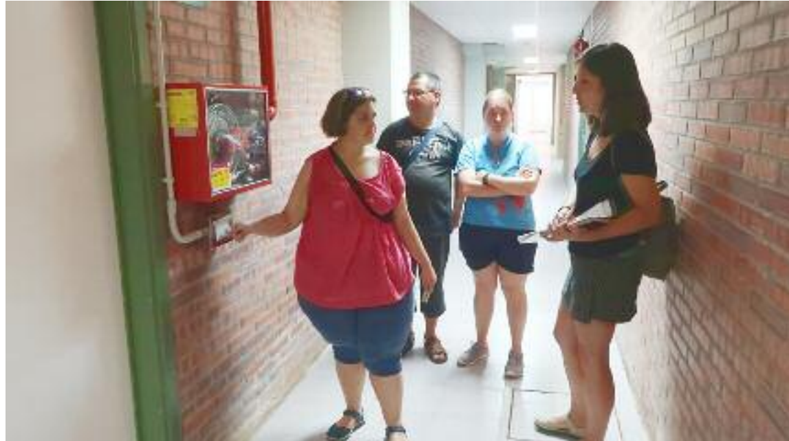
Miembros de la Comisión de Accesibilidad de Atadi, evaluando un edificio en 2019

La comisión de Accesibilidad Cognitiva de Atadi está formada por personas con discapacidad intelectual y técnicas sin discapaci-