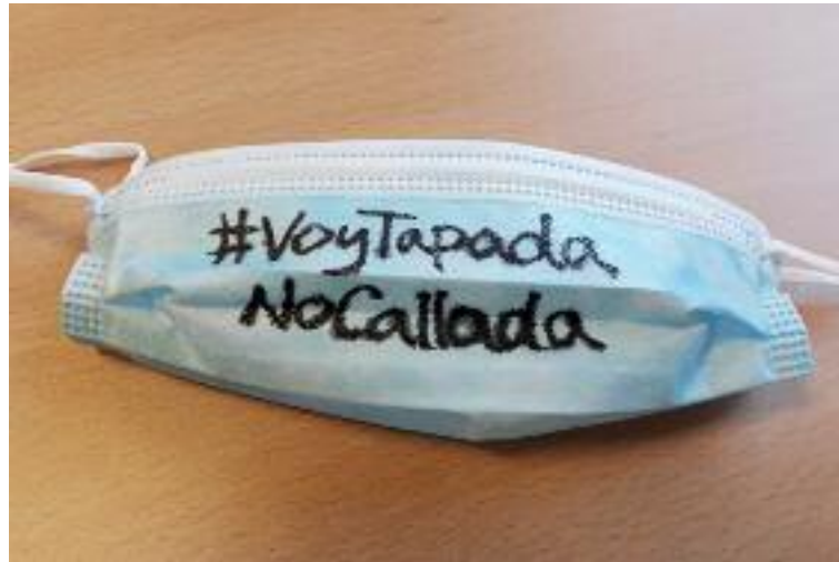
Mascarilla con el lema '#VoyTapadaNoCallada'

Para ello, desde Plena Inclusión han propuesto una acción: