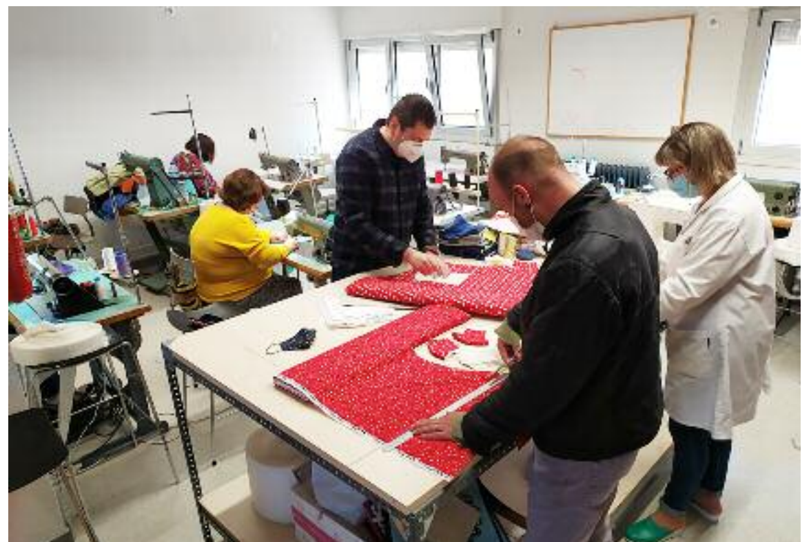
Uno de los talleres de la Asociación de Salud Mental Teruel

Además, en la tienda Corte y Telas se pueden adquirir todo ti-