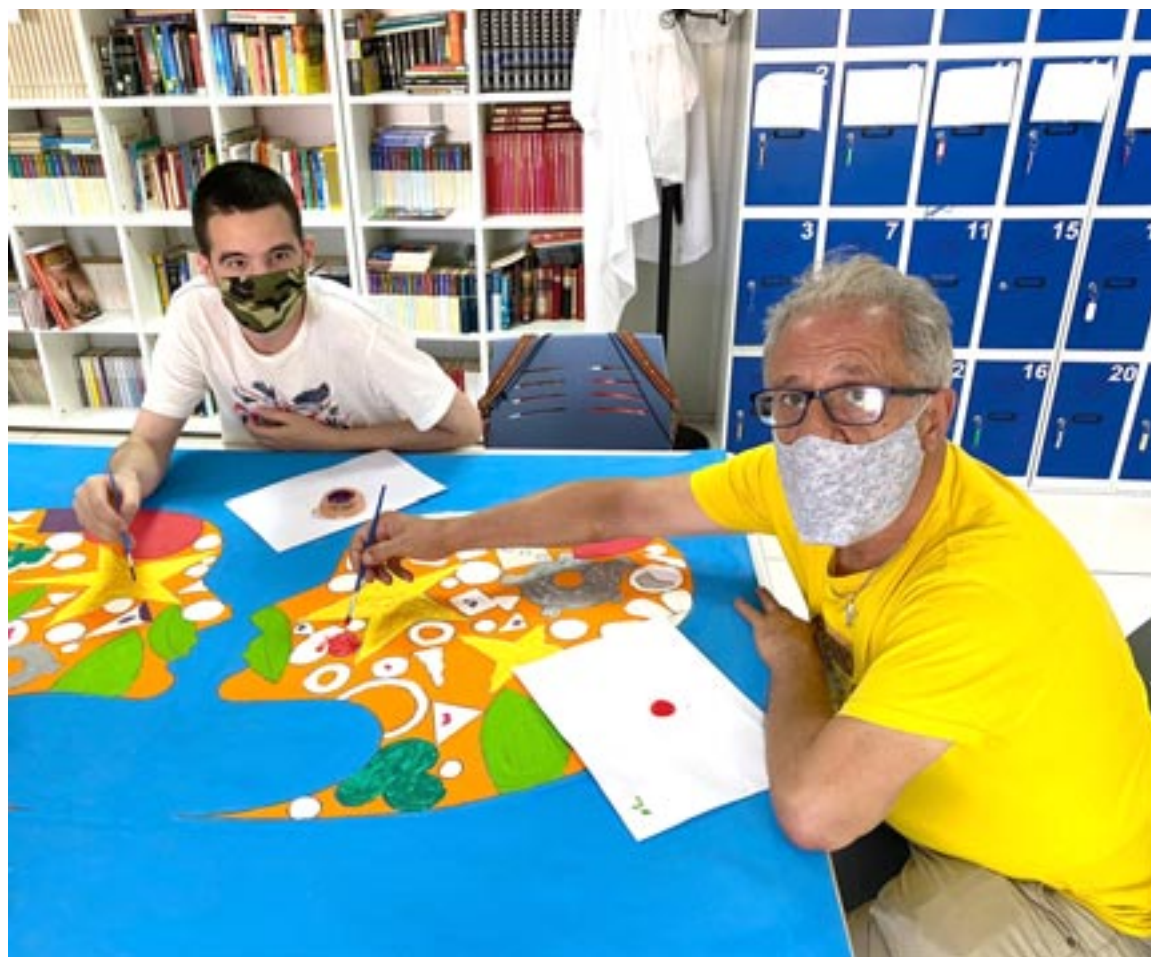
Dos usuarios del centro de día de Asapme Bajo Aragón en uno de los talleres

encuentro entre compañeros, pues debido a la distancia existente entre las diferentes poblaciones, muchos de ellos han pasado separados este tiempo, destacaron desde Asapme Bajo Aragón. Pese al distanciamiento físico que todavía se continúa manteniendo por la seguridad de to-