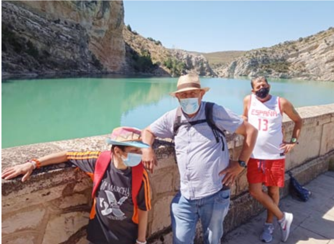
Usuarios de Atadi Andorra en la ruta al embalse de Cueva Foradada, en Oliete

Durante julio y agosto, los centros de Atadi adaptaron sus actividades para ajustarse a las preferencias y características de sus usuarios, personas con discapacidad intelectual cuyas necesidades de apoyo son muy variables de unas a otras. El aumento de temperaturas, unido a la menor demanda de trabajo en los centros ocupacionales, propicia que abunden las actividades al aire libre y en contacto con la naturaleza, aprovechando que los centros de Atadi se encuentran ubicados en el medio rural turolense. Por ello son muy habituales las "escapadas a localidades cercanas de la propia provincia de Teruel, la realización de rutas senderistas, el baño en piscinas o pozas, los juegos en rincones naturales cercanos a los centros" y otras propuestas similares, apuntaron fuentes de Atadi.