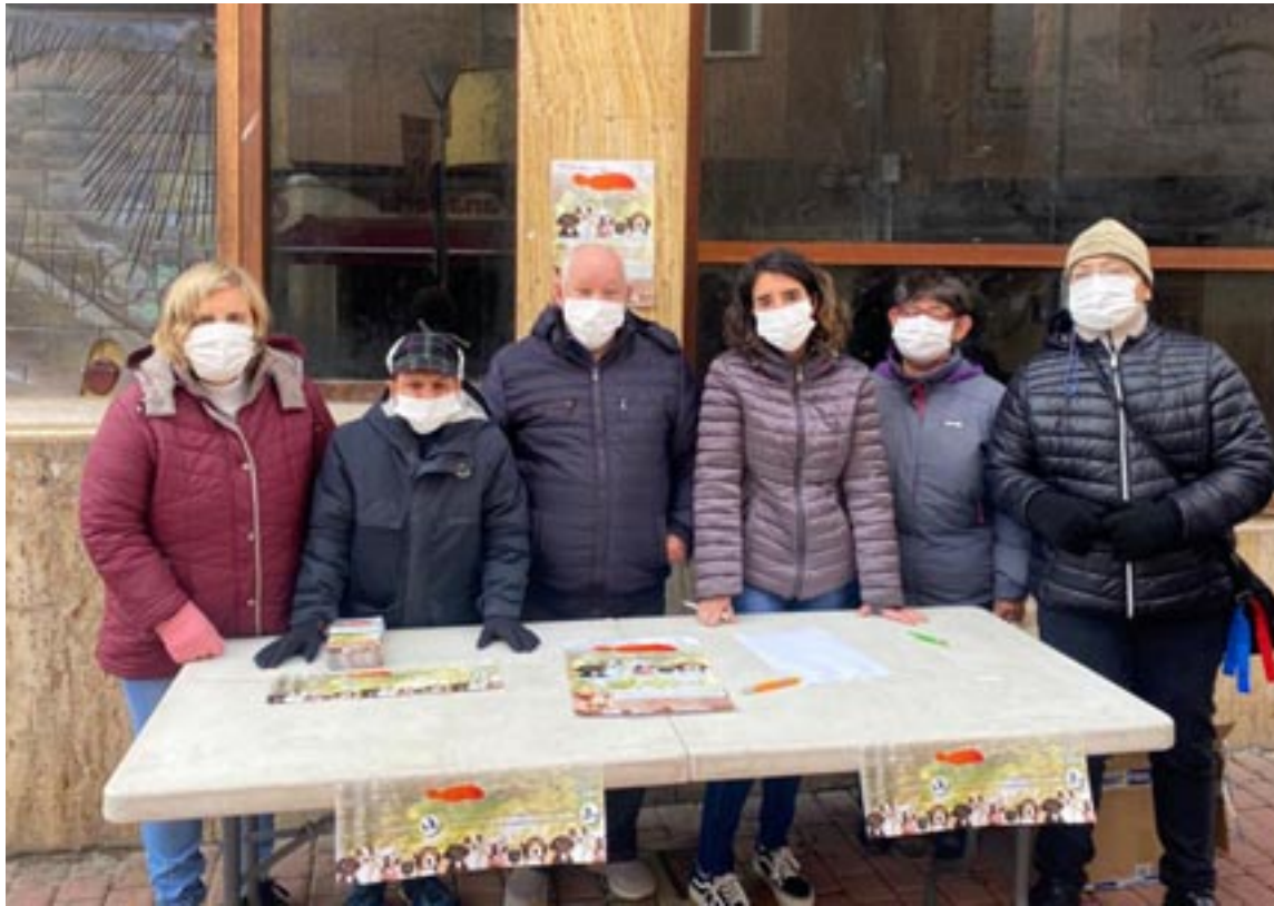
Usuarios de Atadi Andorra en una mesa informativa

“Esta gran colaboración es importante, ya que disponer de un entorno limpio y agradable es responsabilidad de todos y a todos beneficia”, argumentaron desde la entidad.