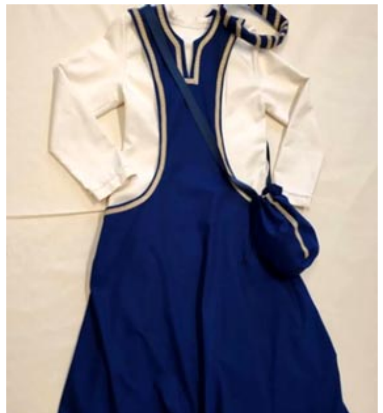
Uno de los trajes medievales confeccionados en el CCE de Asapme Teruel

Corte y Telas pertenece a Asapme Teruel y gran parte de sus productos están confeccionados en su Centro Especial de Empleo, en el que trabajan personas con problemas de salud mental por lo que, comprando sus productos, el cliente no solo consigue un atuendo original y personalizado, sino que ecolabora con una buena causa.