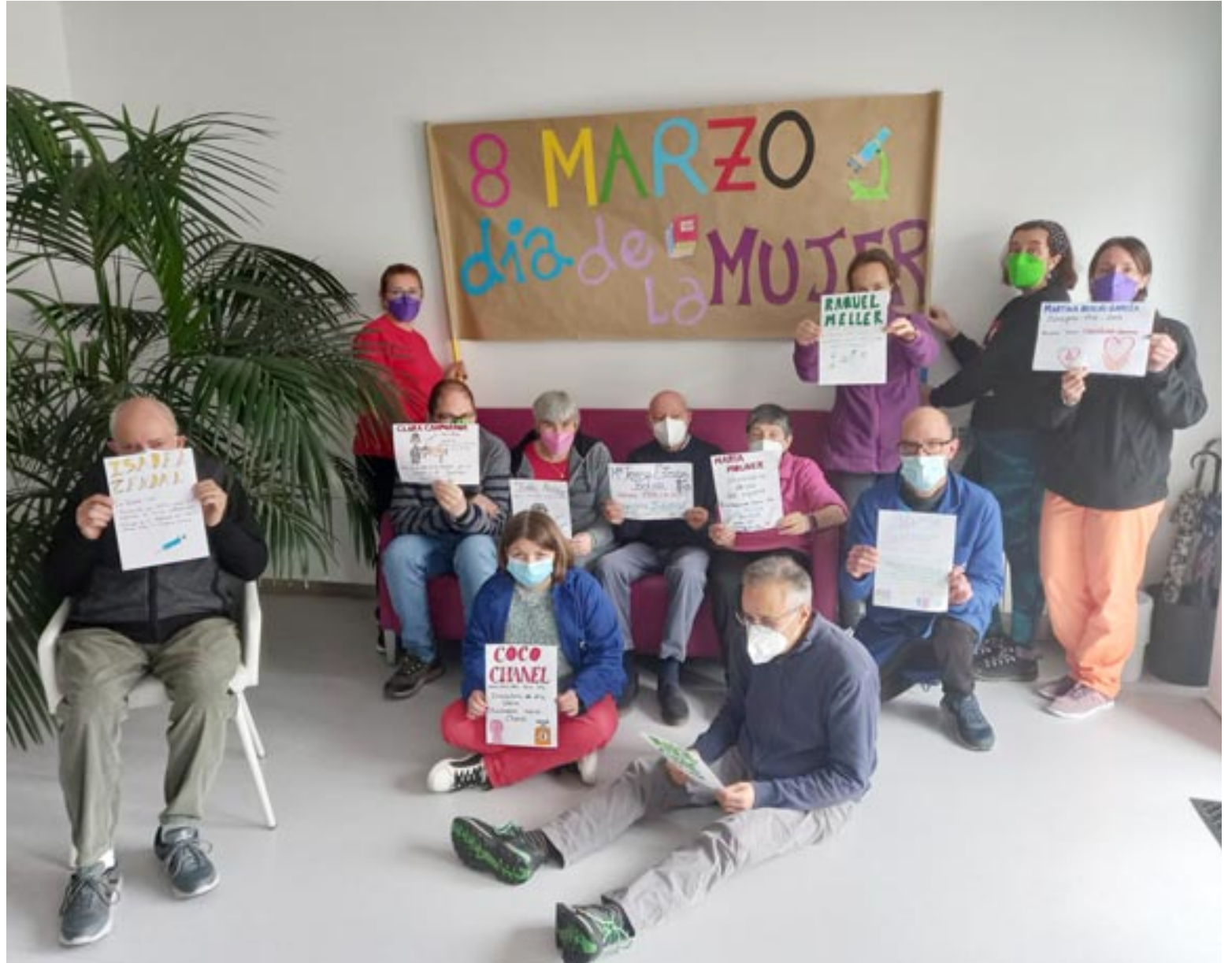
El centro Atadi de Mora de Rubielos celebra el Día de la Mujer

A lo que se añade que “sufrimos más la pobreza. Solo una de cada cinco mujeres con discapa-