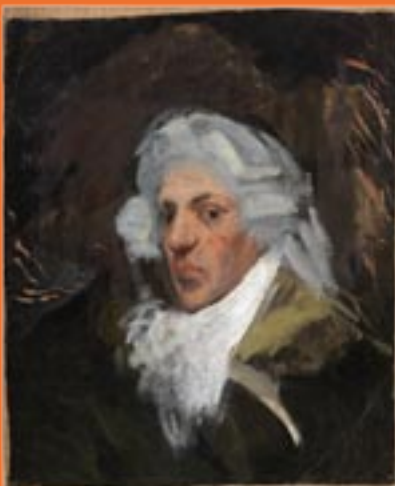
© Sucesión Pablo Picasso. VEGA, Madrid, 2021

Con el grito “¡Por nuestros derechos! ¡Por todas las mujeres!” finalizó un manifiesto tras el que las mujeres con discapacidad intelectual, sus compañeros y los profesionales de Atadi prorrumpieron en aplausos.