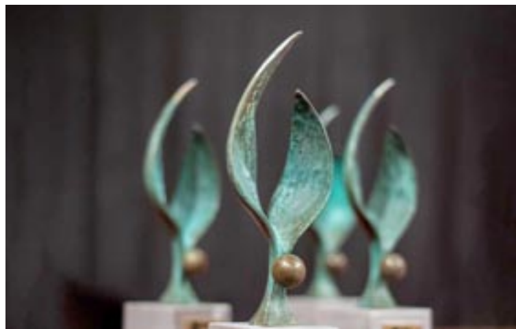
Galardones de Fundación DFA

El Ayuntamiento de Jaca ha sido reconocido por el compromiso por la accesibilidad, tanto en las calles como en los edificios públicos. Este compromiso se ha trasladado también a las ordenanzas municipales que obligan a que los comercios que, o bien se vayan a abrir o bien se reformen, lo hagan incorporando criterios de accesibilidad de manera que se facilite a las personas con discapacidad el acceso a los locales comerciales. El consistorio también convoca anualmente