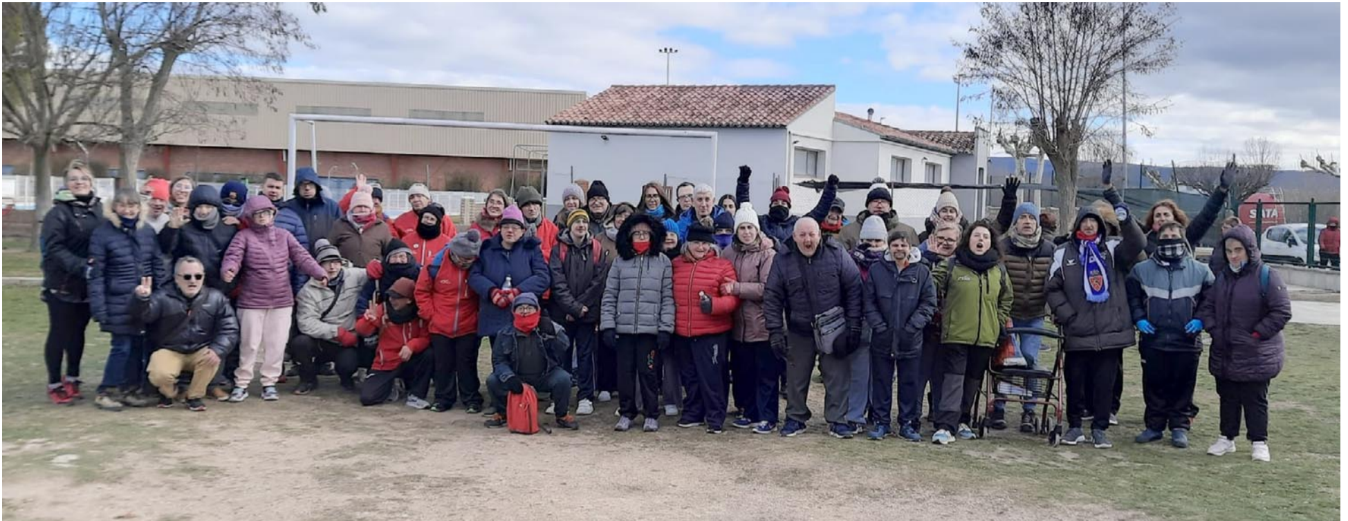
Deportistas y monitores de apoyo en el Campeonato de Petanca celebrado en Monreal del Campo