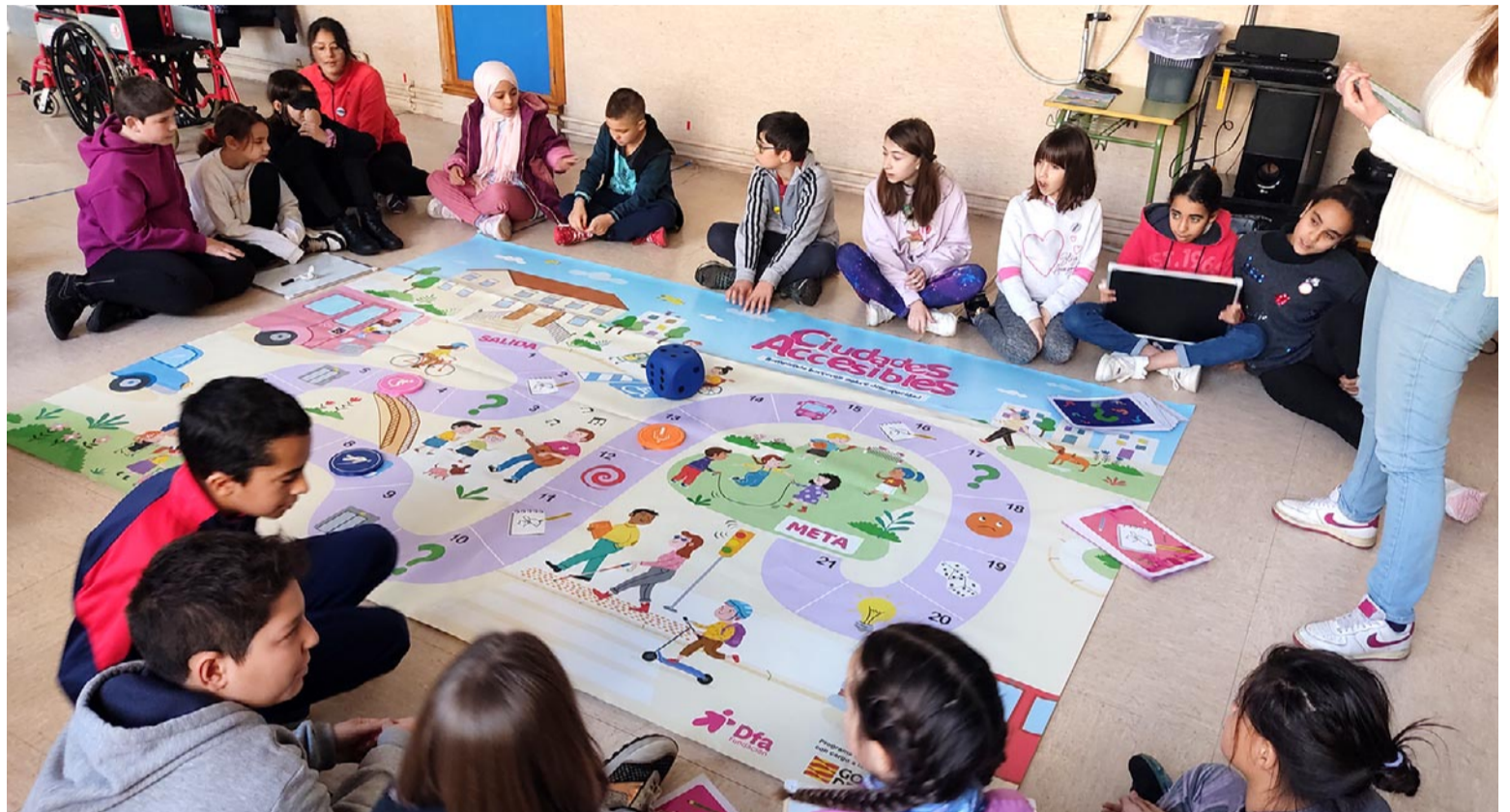
Los participantes en el juego 'Ciudades accesibles' desarrollado por Fundación Dfa en el Criet de Alcorisa

El desarrollo del juego, dirigido al alumnado de 4º a 6º de Educación Primaria, consiste en completar un recorrido de forma colaborativa entre los equipos con tres tipos de pruebas diferen-