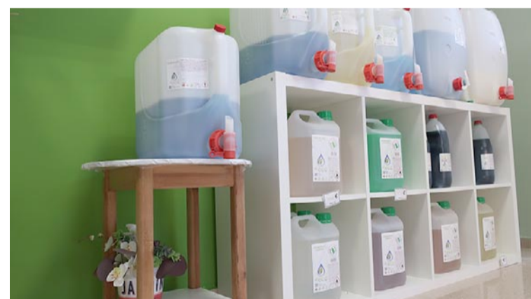
Productos de limpieza a granel expuestos en Diverco, la tienda de Atadi

Además, comprar en Diverco es una manera de contribuir a que las personas con discapacidad intelectual cuenten con los