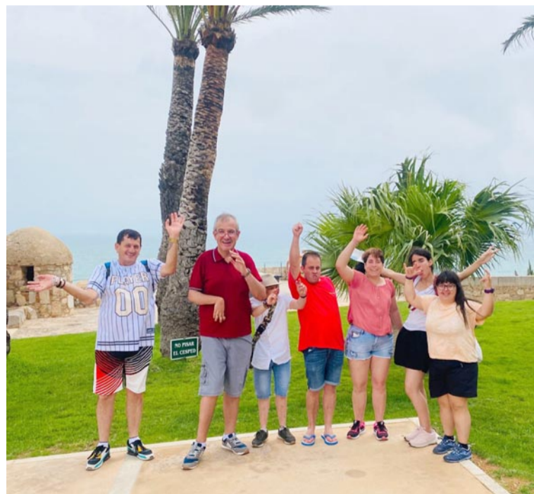
Usuarios de Atadi, de vacaciones en Peñíscola

Disfrutar de unos días de vacaciones es necesario para todas las personas, pues supone un cambio de aires que es muy beneficioso a nivel psicológico y emocional. Además, permite conocer otros lugares, hacer actividades diferentes y escapar de la rutina. Para las personas con dis-