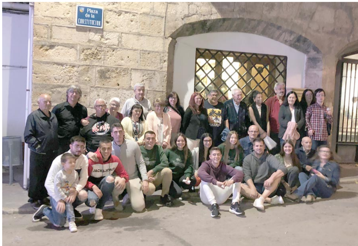
Usuarios y familias de Atadi Sierra de Albarracín con la Comisión de Fiestas de Villar del Cobo