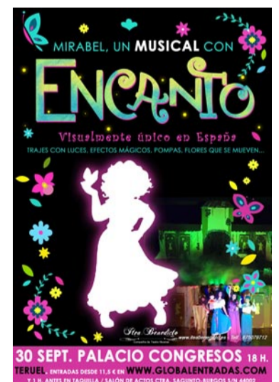
Cartel del musical

Los usuarios de Anudi que pudieron disfrutar del musical con las canciones de Frozen salieron encantados y están deseando acudir a este evento adaptado a sus necesidades, aseguraron desde la asociación.