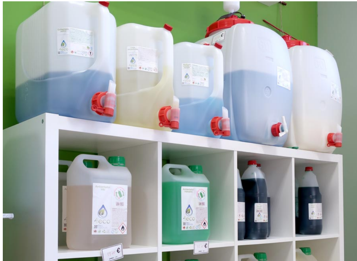
Productos de limpieza ecosostenibles a granel en Diverco

Los clientes pueden elegir el producto de limpieza que necesitan, con multitud de aromas a elegir, que se vierte en un envase reutilizable que pueden volver a rellenar cuando el producto se acabe. “Reutilizar los envases el mayor número de veces posible es uno de los mejores hábitos de consumo que podemos adoptar para reducir nuestro impacto ambiental”, resume Arroyas.