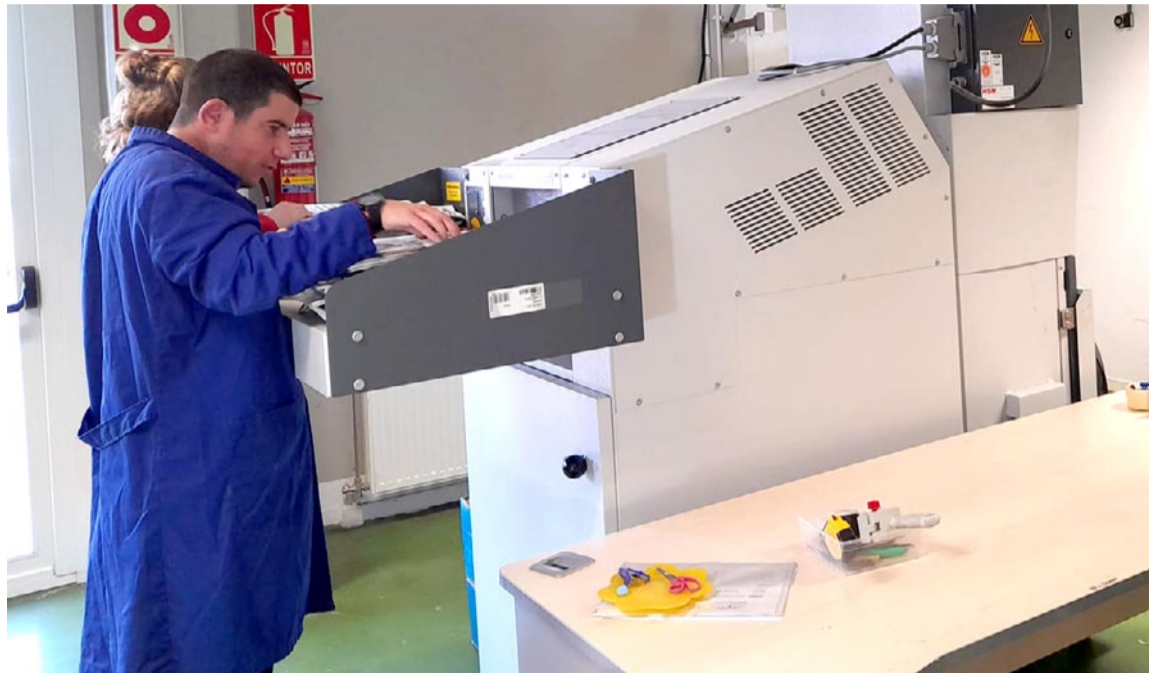
Triturado de papel de periódico en Atadi Valderrobres

Por ello, desde Atadi "deseamos agradecer la colaboración de comercios, establecimientos e instituciones, que guardan los periódicos y nos los entregan pa-