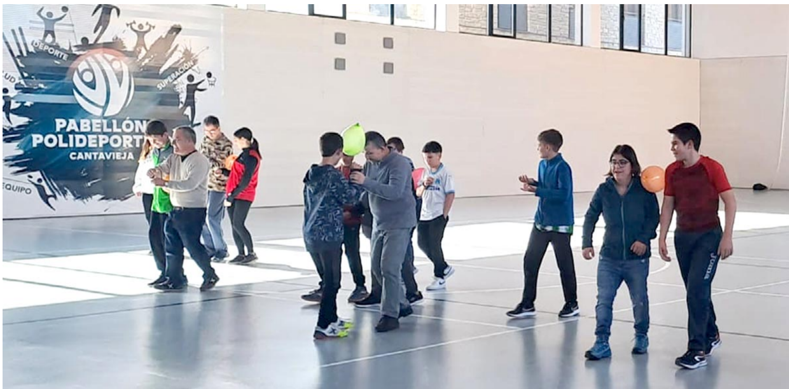
Una de las clases inclusivas de Educación Física realizada por personas usuarias de Atadi Maestrazgo y alumnado del SIES Segundo de Chomón de Cantavieja