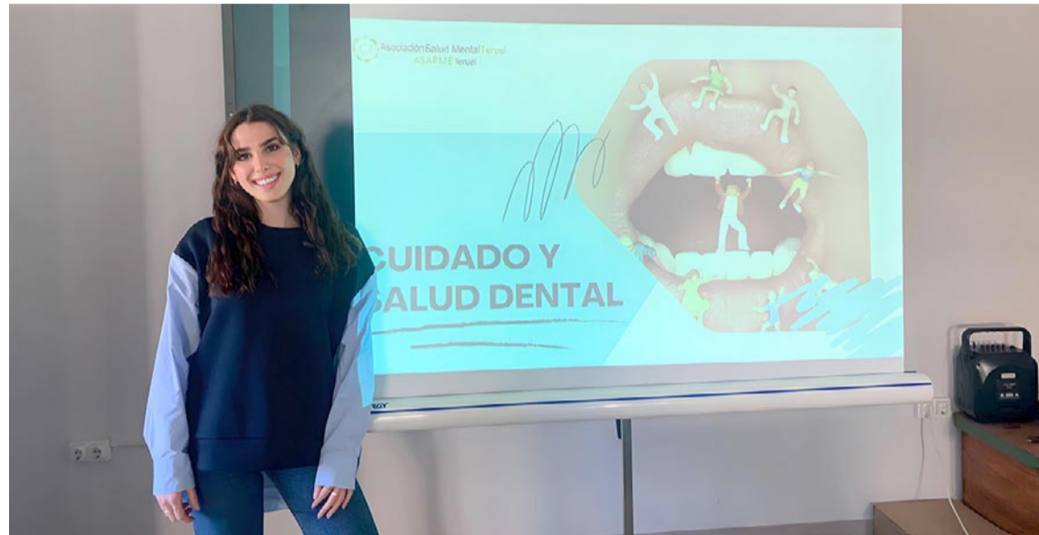
Profesional del ámbito odontológico que ofreció un taller sobre salud bucodental en Asapme Teruel

Los asistentes adquirieron un profundo entendimiento de condiciones como la caries dental y la enfermedad periodontal, aprendiendo cómo prevenirlas y cuidar su salud oral de manera