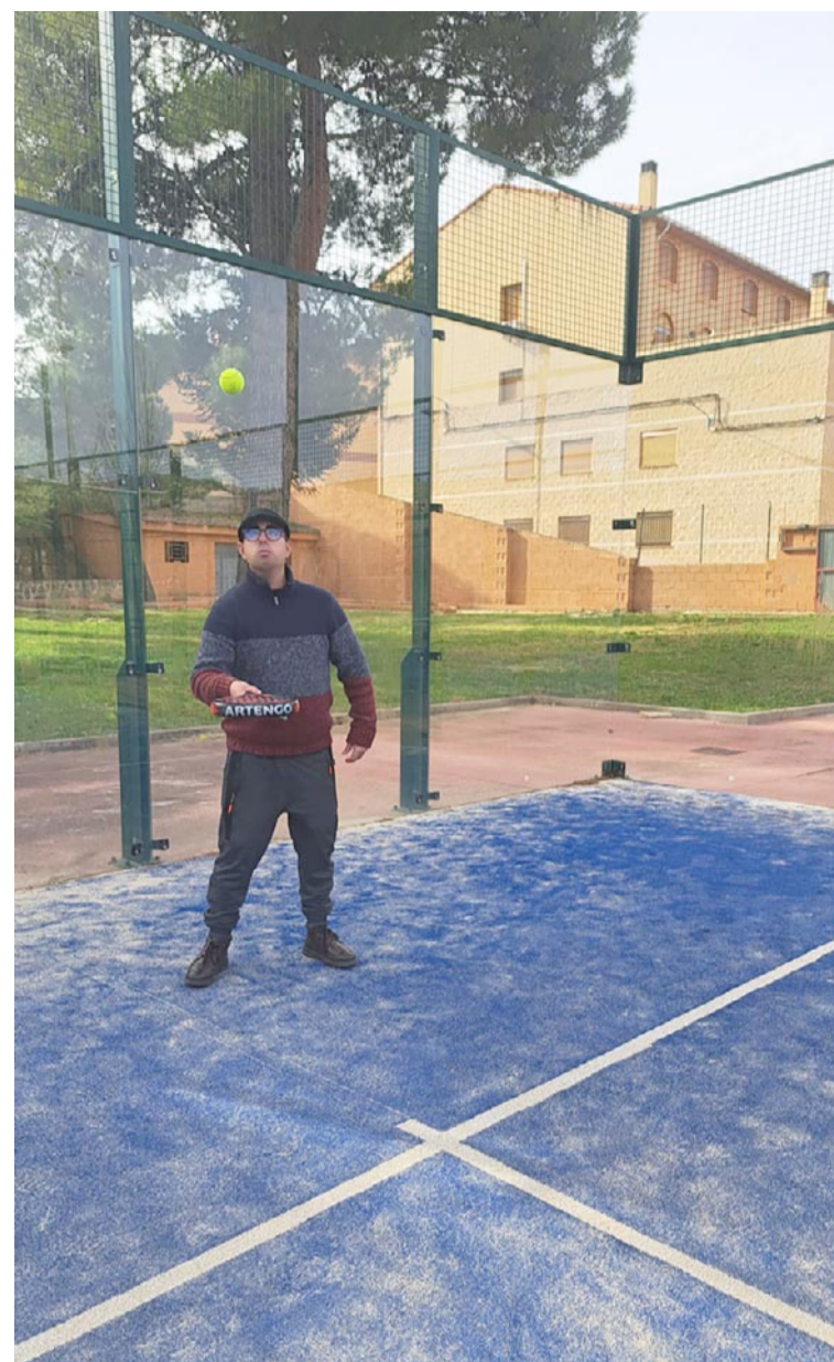
Los usuarios de Atadi realizan entrenamientos de pádel

Atadi forma parte de Faddi Aragón, la delegación en Aragón de la Federación de Deportes para Personas con Discapacidad Intelectual. Además, la entidad representa a Plena Inclusión Aragón en la junta directiva de Special Olympics Aragón.