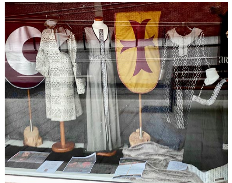
Los vestidos que lucirá el grupo de música medieval turolense ArteSonado

“En definitiva, la celebración de Santa Águeda en Alcañiz fue todo un éxito. Se trata de momentos de diversión y emoción que marcan estas jornadas especiales, dejando en el recuerdo de todos un día inolvidable lleno de alegría y buenos momentos”, señalan desde la entidad.