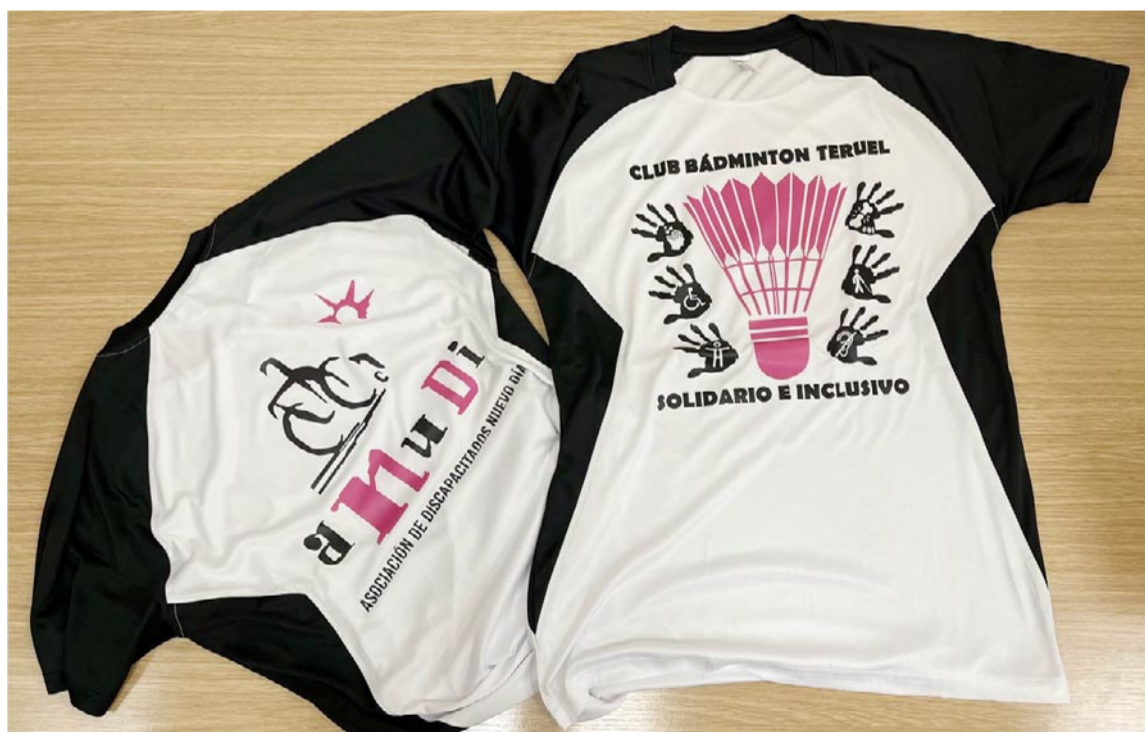
Camisetas a la venta del Club Bádminton Teruel, cuyos beneficios se destinan a Anudi

Las camisetas, además de ser solidarias, tienen un diseño muy atractivo y están hechas en material técnico ideal para la práctica de deportes. Los responsables de Anudi quisieron hacer público el agradecimiento a esta entidad deportiva turolense por su colaboración.