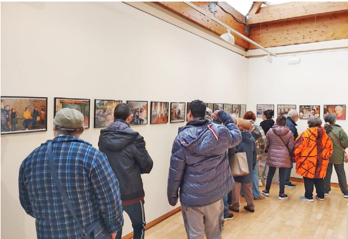
Los usuarios de Asapme Bajo Aragón, durante la visita a la exposición del CPEPA Río Guadalupe de Alcañiz