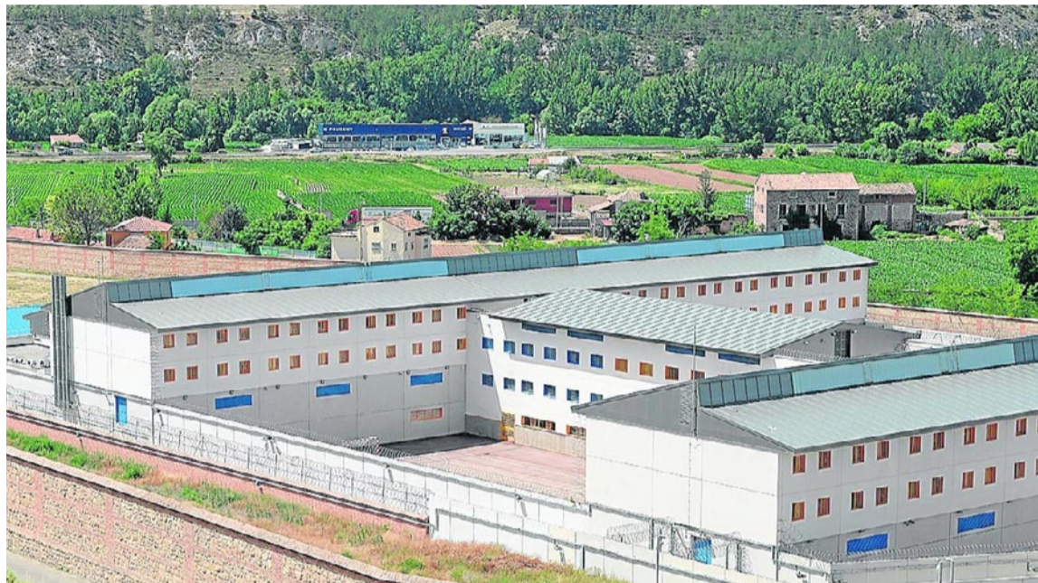
Centro penitenciario de Teruel.

Desde Asapme Teruel se lleva a cabo en el Centro Penitenciario de Teruel el programa de atención integral a personas con en-