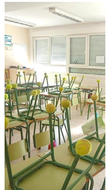
CEIP Virgen de la Hoz

Es por ello que desde Asapme Teruel se están impartiendo sesiones informativas a los y las profesionales del Centro Penitenciario de Teruel con el objetivo de facilitar herramientas y pautas para el trato con internos con enfermedad mental y poder comprender mejor su situación.