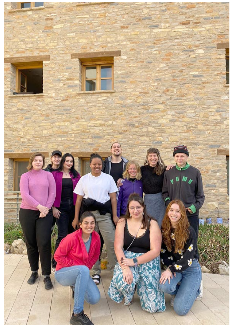
Los jóvenes voluntarios europeos de Atadi, en el centro de Cantavieja

Este proyecto forma parte del Cuerpo Europeo de Solidaridad gestionado y financiado por la Comisión Europea. Estos jóvenes llegan a España de la mano de organizaciones acreditadas por el programa de voluntariado en sus respectivos países, que les aportan formación, apoyo y asesoramiento para facilitar el desarrollo del proyecto. El programa incluye los gastos del viaje hasta el cen-