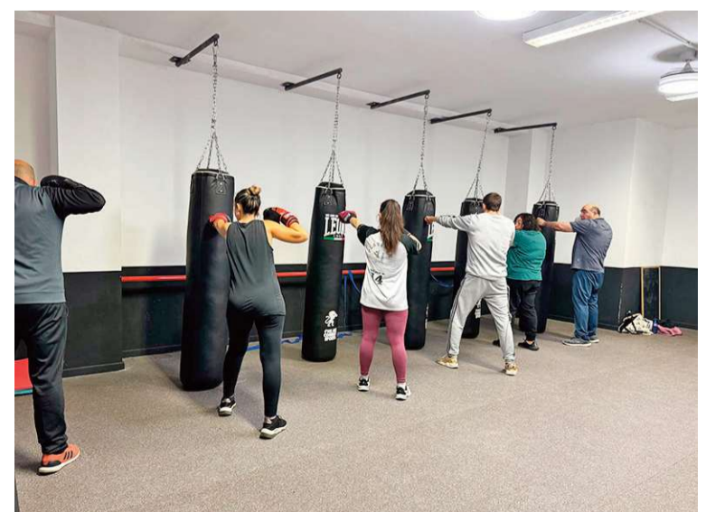
Clase de fitboxing en el Club Kickboxing Teruel

Los resultados del programa son tan positivos que los participantes expresan que esta sesión semanal se ha convertido en un pilar en su rutina. Al término de cada sesión, el ambiente es de apoyo mutuo, reforzando los la-