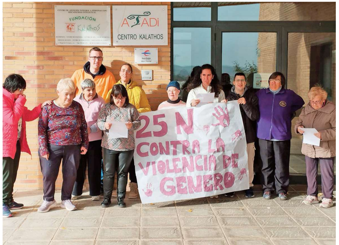
Concentración con motivo del Día Internacional de la Eliminación de la Violencia contra la Mujer en un centro de Atadi

Por todo ello, las mujeres con discapacidad exigen “que se atienda a las víctimas de violencia de género con discapacidad desde programas y servicios especializados, que deben estar asesorados por las entidades que atienden a este colectivo”. A lo